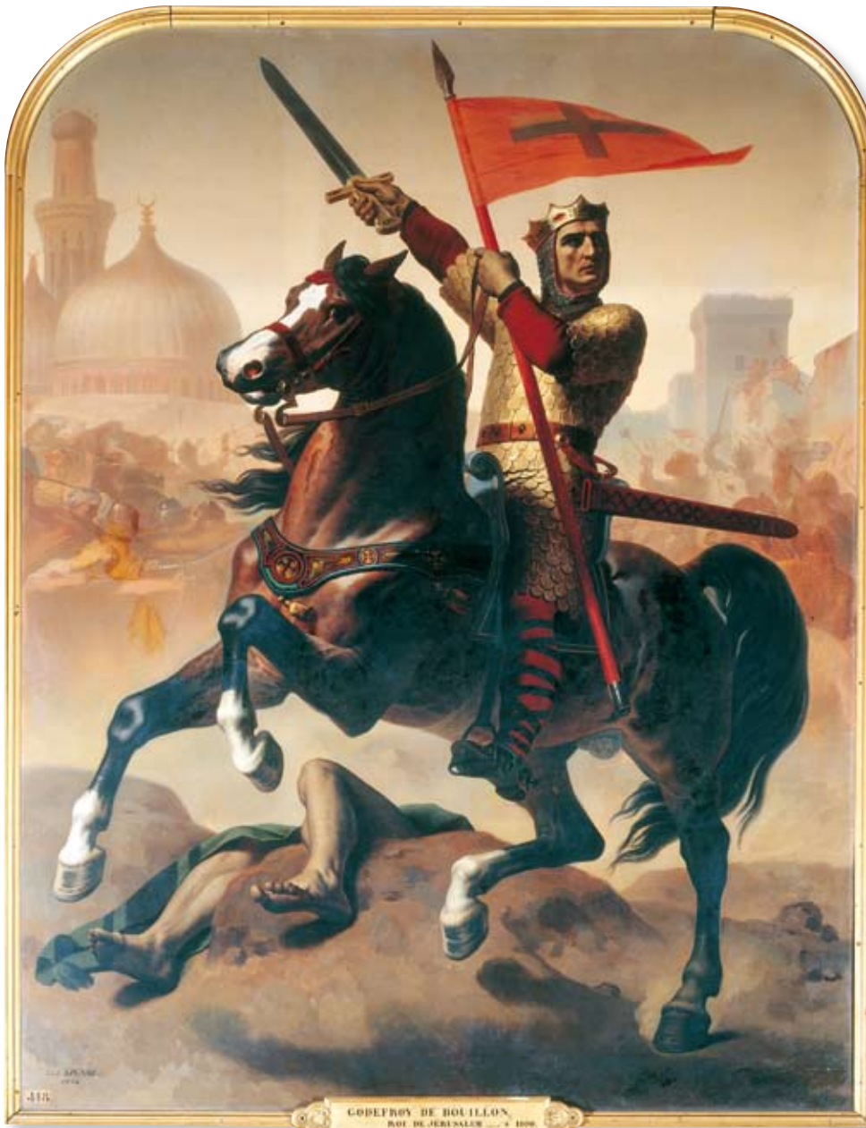
Godfrey IV, duc de Basse-Lorraine, dit Godfrey de Bouillon

Baudouin était frère de l'illustre Godefroi de Bouillon.