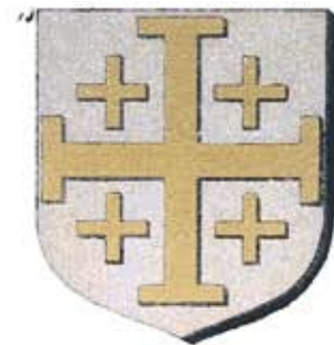
Armoiries de Baudouin I er

Baudouin I er roi de Jérusalem par M-J Blondel