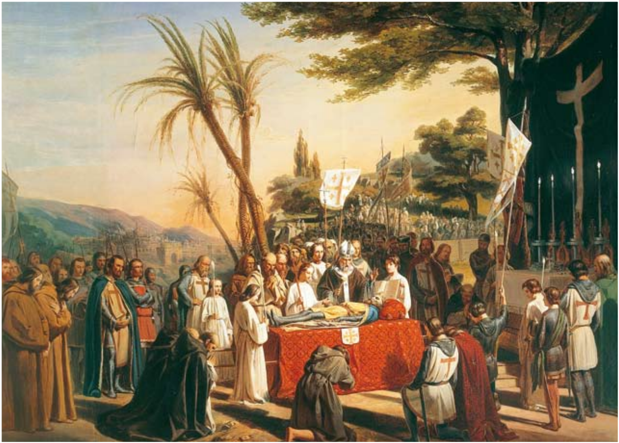
Funérailles de Godefroy de Bouillon sur le calvaire. 23 juillet par Edouard Cibot

Image issue du livre « Les salles des Croisades du château de Versailles » de Claire Constans et Philippe Lamarque ; éditions du Gui et château de Versailles 2002