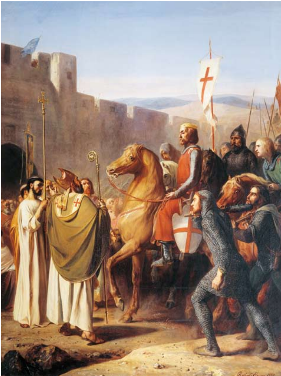
Arrivée de Baudouin, comte de Flandre, à Edesse. 20 février 1098 par J-N Robert-Fleury

compte. Lorsque ce dessein fut connu, Godefroi et les autres généraux réunirent tous leurs efforts pour détourner le jeune chevalier de son entreprise coupable. Mais il demeura sourd à toutes les supplications. A la tête d'une poignée d'hommes, il s'avança vers l'Arménie, et frappant les Turcs de terreur à force d'audace, il parvint jusque sous les murs d'Edesse. Ville autrefois royale, Edesse, célèbre au temps de la primitive Eglise, était la métropole de la Mésopotamie. Elle était gouvernée, sous la suzeraineté des Sarrasins, par un prince grec qui y commandait au nom de l'empereur Alexis. L'approche et les victoires des croisés produisirent la plus vive sensation dans la ville. L'évêque et douze des principaux habitants furent députés auprès du prince croisé, pour le conjurer de sauver une ville chrétienne de la domination des infidèles. Baudouin céda facilement à leurs prières.