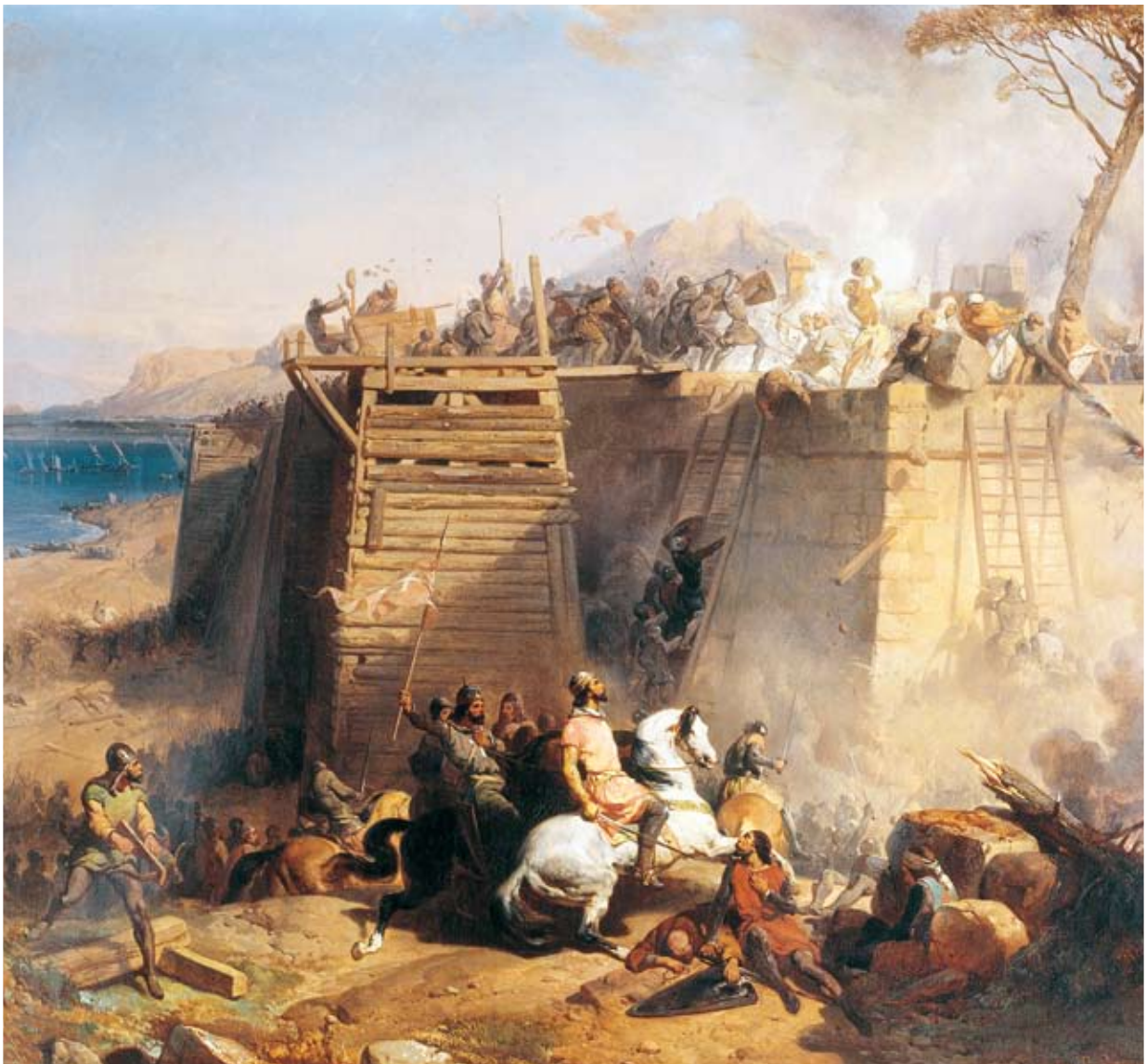
Prise de Beyrouth. 13 mai 1110 par Eugène Delacroix

Il allait entreprendre le siège de Tyr, lorsqu'il fut atteint de la dysenterie à El-Arisch. Sentant sa fin approcher, le prince rassembla autour de lui ses compagnons d'armes : « Je vais mourir, leur dit-il, mais ne vous en troublez pas. Vous ne perdez en moi qu'un seul homme, et vous avez parmi vous plusieurs chefs plus habiles que moi. Restez donc unis, et accordez-moi une dernière faveur: que mon corps soit transporté à Jérusalem et enseveli dans le tombeau où repose mon noble frère Godefroi ! »