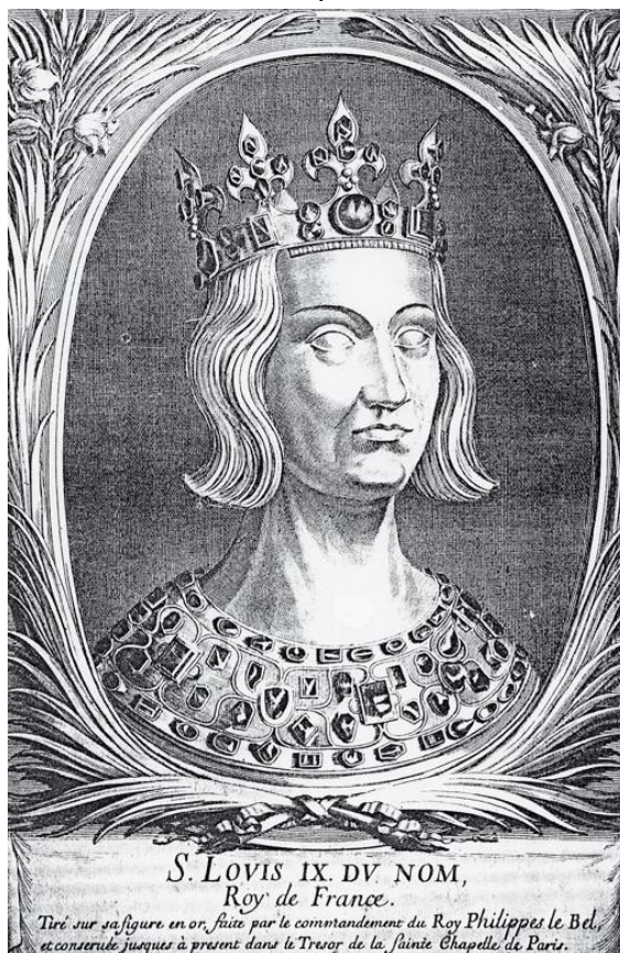
Chef reliquaire de Saint Louis à la Sainte Chapelle