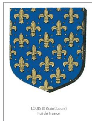
Armoiries de Louis IX (Saint Louis)

Les salles des Croisades 2002 - © éditions du Gui 2002