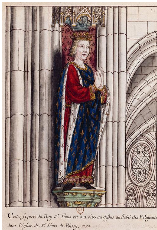
Statue de Saint Louis en la Priorale Saint Louis de Poissy Aquarelle de la collection de Raoul de Gaignières (la statue ayant probablement disparue)

Écrivant en 1309 son Livre des saintes paroles et des bons faiz nostre saint roy Looÿs (c'est la Vie de saint Louis ) Joinville écrit donc Looys dans sa dédicace à Louis X, le Hutin, roi de Navarre, et pour évoquer « nostre roy saint Looys », ce qui revient pour ainsi dire à ce qu'on écrivait en 1254. Il donne aussi la forme Loys. Reste maintenant à imaginer comment on prononçait ce Lo(o)is : Lo-o-is , Lôis ? Qui le saura ?