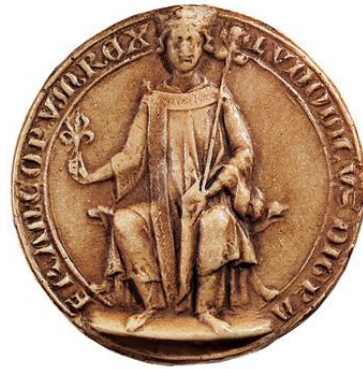
Premier sceau de majesté de Saint Louis (1226-1250)

Abandonnons ce petit jeu destiné à montrer la continuité des trois dynasties, d'ailleurs toutes parentes, que j'ai essayé de montrer une nouvelle fois dans La Symbolique royale française comme on le lira plus loin.