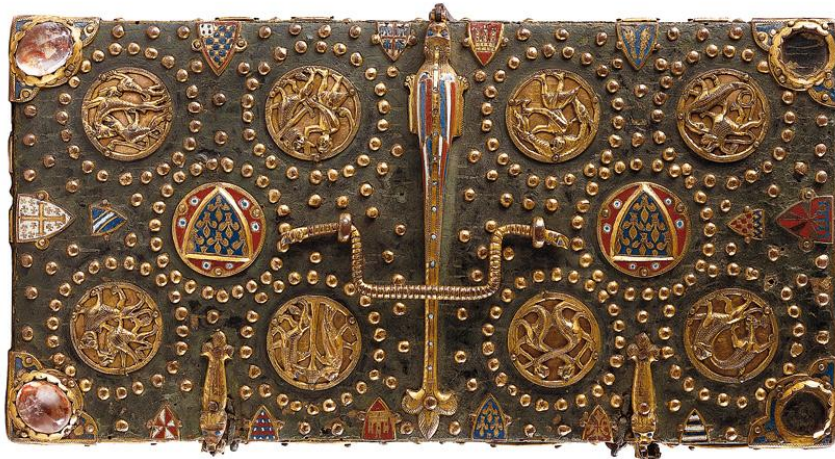
Couvercle du coffret ou cassette de Saint Louis