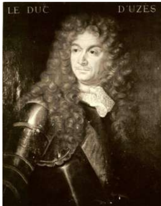
Jean-Charles de Crussol, 7 ème Duc d'Uzès – Maison ducale d'Uzès

Jean-Charles de Crussol a épousé le 17 janvier 1696 en première noce, Anne-Hyppolyte de Grimaldi, fille du Prince de Monaco, qui est morte en couche sans postérité le 23 juillet 1700. Des secondes noces avec Anne-Marguerite de Bullion de Fervaques le 13 mars 1706, naissent trois enfants ayant vécu : Charles-Emmanuel, Duc de Crussol puis Duc d'Uzès - Louis-Emmanuel en 1711, Marquis de Florensac et capitaine des vaisseaux du Roi - Anne-Julie Françoise en 1713 qui épousera Louis-César de La Baume le Blanc, Duc de Vaujours puis Duc de La Vallière.