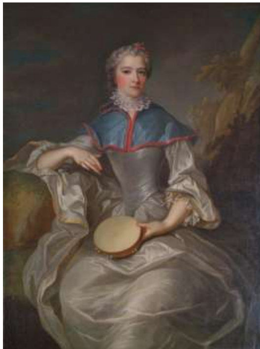
Julie Françoise de Crussol, marquise de La Vallière – Maison ducale d'Uzès

Les lettres sont toutes traitées comme ci-dessus dans le livre : Retranscrites et accompagnées d'une exégèse.