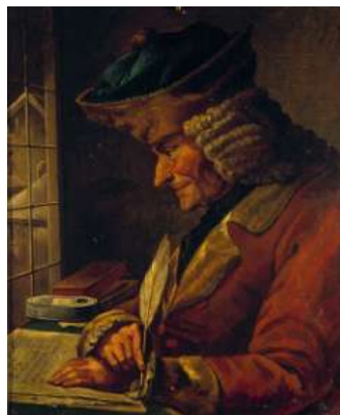
A gauche : Charles-Emmanuel de Crussol, 8 ème Duc d'Uzès A droite : Voltaire dans son cabinet